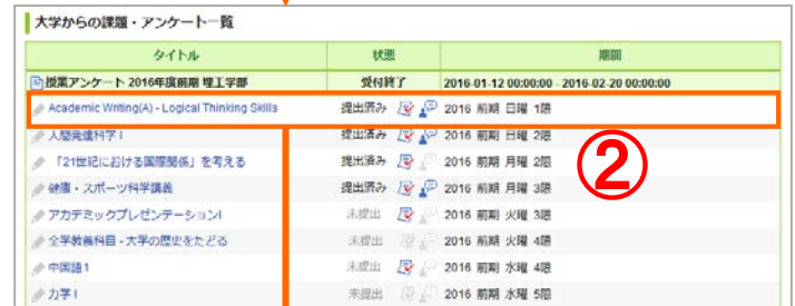
大学からの課題・アンケート一覧

③ 提出確認画面を開くと、結果ファイルや教員からのフィードバックを確認できます。