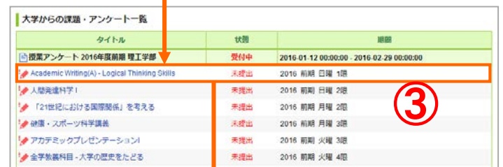
大学からの課題・アンケート一覧