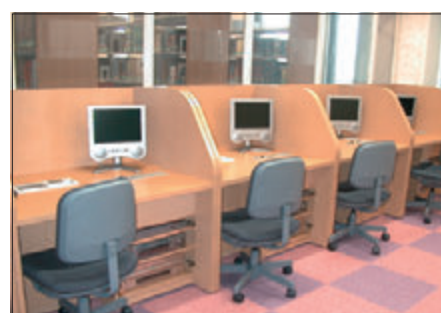
LL自習ブース(発音練習もできます)

なお、東学習室入口正面の自習用パソコン(インターネットに接続可能)でも、LL授業の教材を利用した学習ができます。