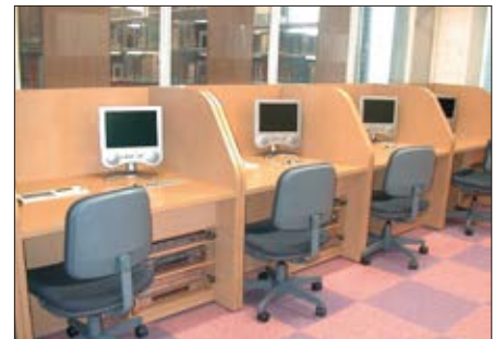
LL自習ブース(発音練習もできます)

なお、東学習室入口正面の自習用パソコン(インターネットに接続可能)でも、LL授業の教材を利用した学習ができます。